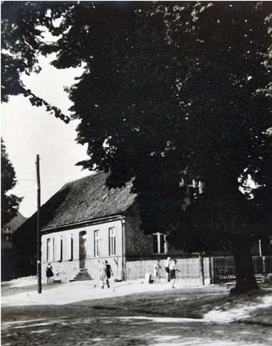
Schule Mellin 1950