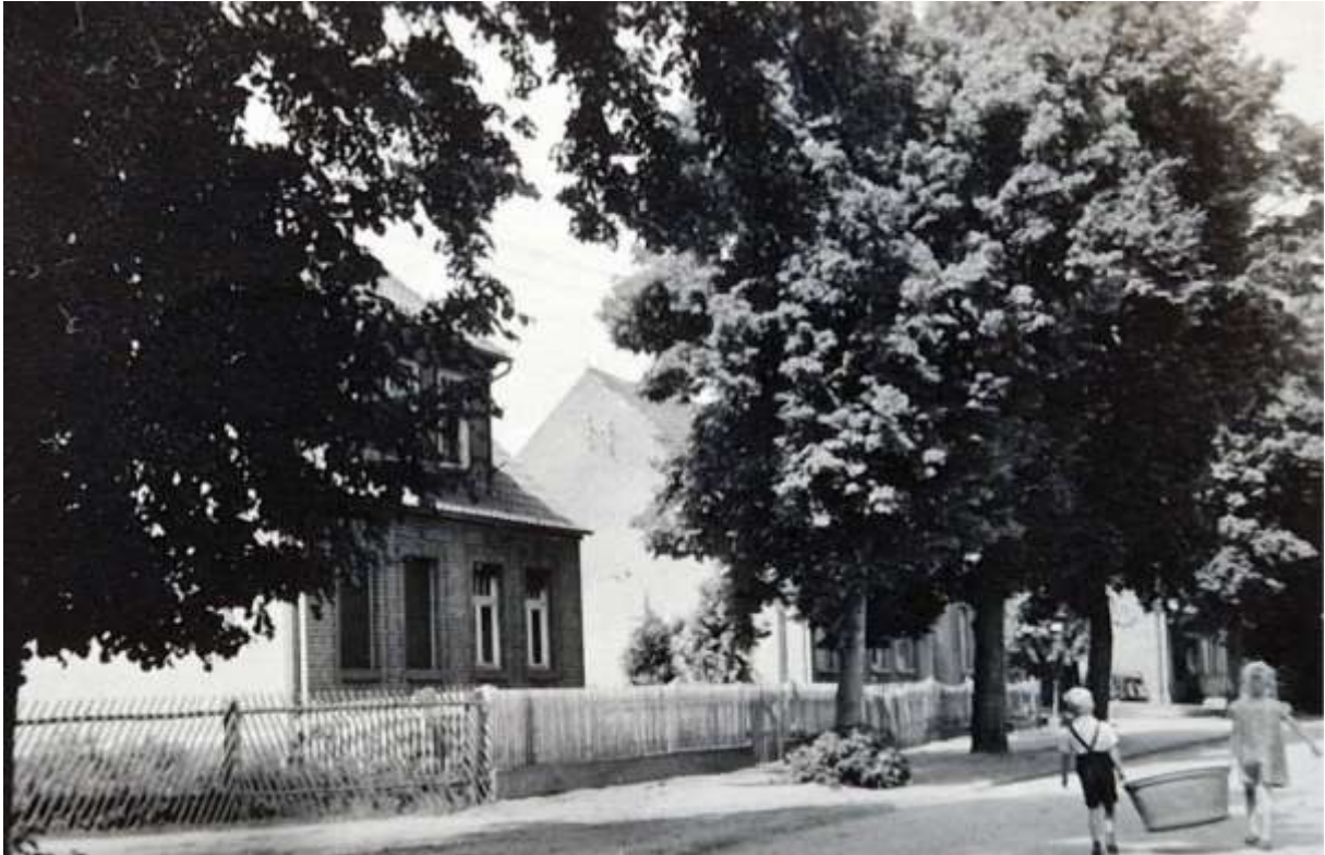
Dorfstraße in Mellin